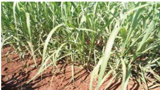
Figura 1 Stand sem falhas em plantio de cana com uso de Ethephon

As falhas no plantio representam grande perda de produtividade. Um canavial que deveria produzir 120 t/ha, mas encontra-se com 8% de