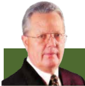
AFOCAPI SICOOB COCREFOCAPI SINDIRPI