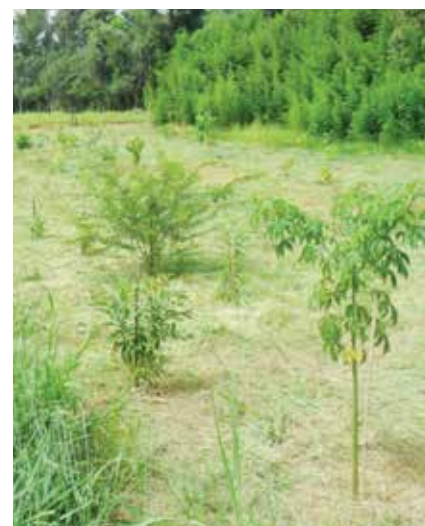
Mudas em formação