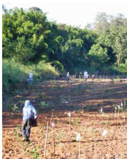
Realização de plantio de mudas estaqueadas